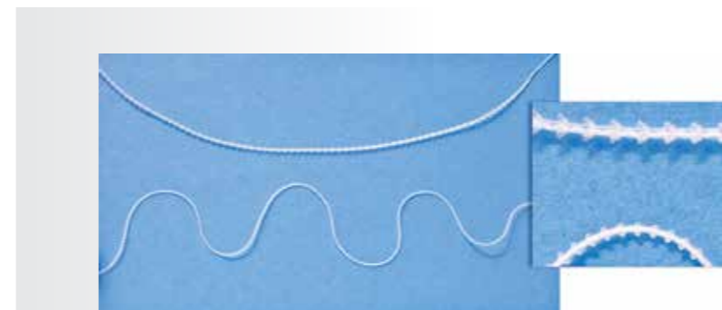
Elastyczne, plastyczne 24 zbieżne haczyki 3D na cm

Kolejną zaletą nici jest trwałość i całkowita obojętność dla organizmu. Ten aspekt ma ogromne znaczenie w późniejszym okresie ich zastosowania. Zabieg implantacji nie wymaga specjalnego przygotowania, można go przeprowadzić u Pacjenta w każdym wieku. Okres rekonwalescencji pozabiegowej wynosi do 2 do 3 dni.