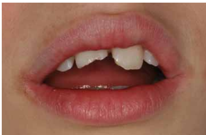
Nieszczęśliwy wypadek. Podczas zabawy na sankach 8-letni chłopczyk złamał sobie obie jedyńki.