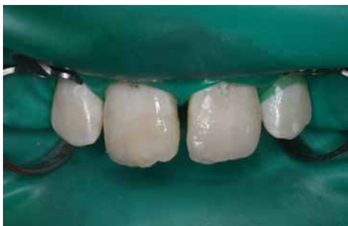
Zostały one przyklejone w gabinecie stomatologicznym.