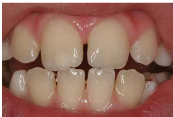
Efekt końcowy po przyklejeniu obu fragmentów.