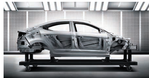
Ultra wytrzymała stal o podwyższonej sztywności

Katowicki serwis Hyundai, jako jeden z trzech w kraju, brał udział w programie organizowanym przez Hyundai Europe, którego celem było