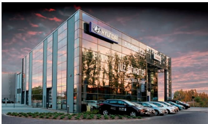
Siedziba Autokopex Cars

Za chwilę miną trzy lata odkąd firma Autokopex Cars, znany na Śląsku i Zagłębiu autoryzowany dealer Hyundai z Mysłowic, pojawił się z nową siedzibą w prestiżowym miejscu przy Alei W. Roździeńskiego w Katowicach.